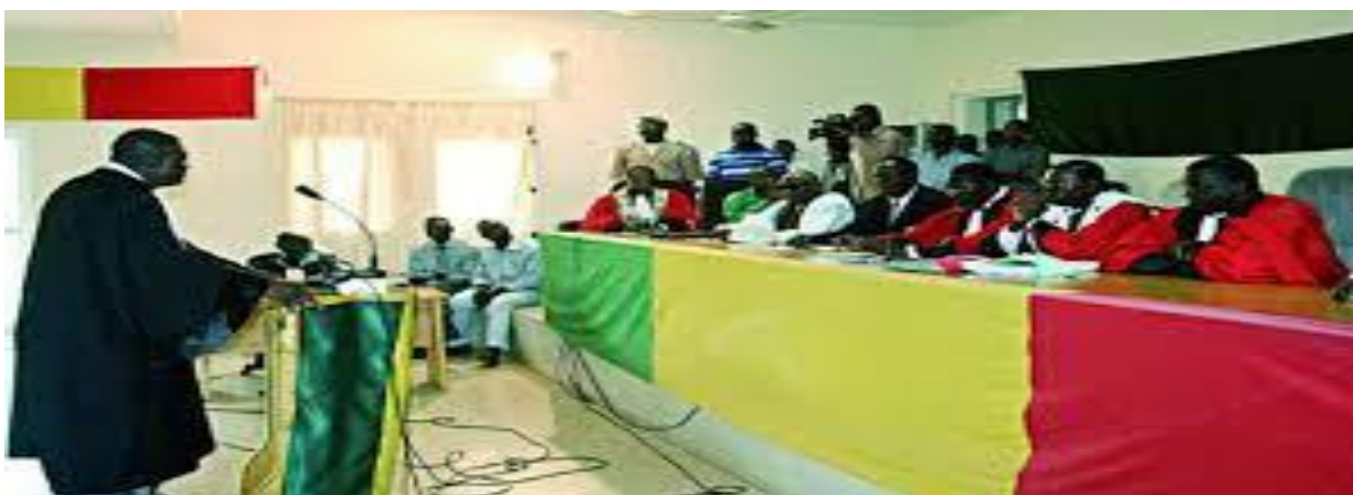
Juges et avocats.

Les juges qui siègent au tribunal de commerce sont des commerçants ; ceux qui siègent au Conseil des prud'hommes sont soit des employeurs, soit des salariés, car ils tranchent les litiges concernant les relations de travail.