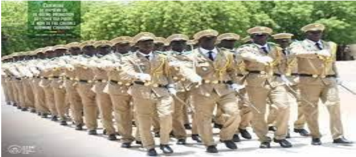
EMIA de Koulikoro.