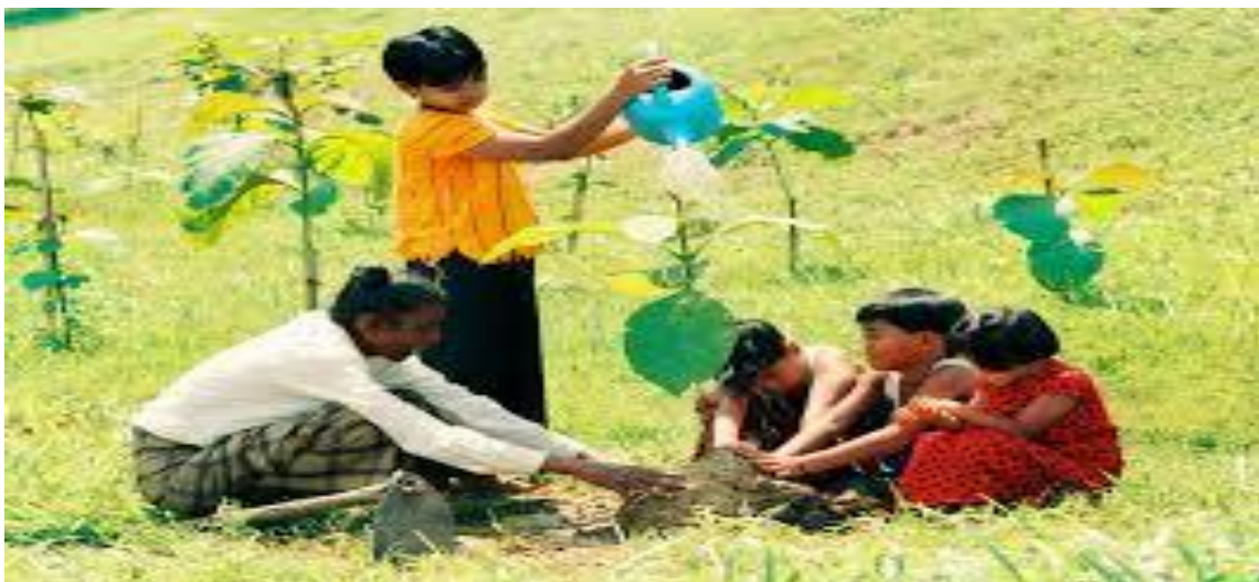
Protection de l'environnement.

Thérapie dure ou méthode douce : en matière de prévention des risques naturels , tels que les inondations , deux philosophies s'affrontent.