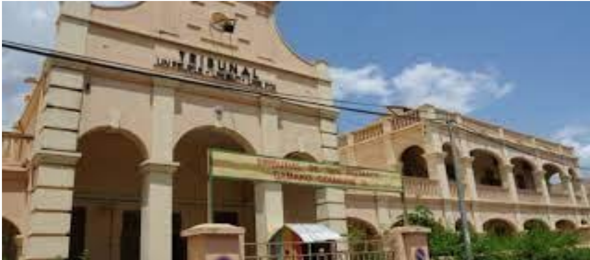
Tribunal de Bamako.