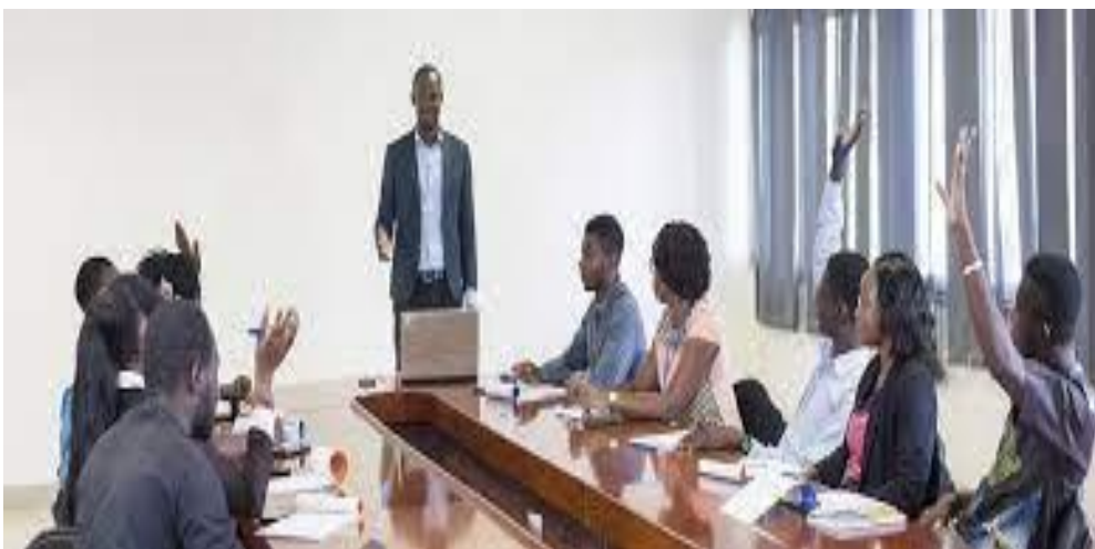
Séance de formation.

Irène Joliot-Curie («Rôle de la Recherche pure dans l'Economie française, Réalités », mai 1946).