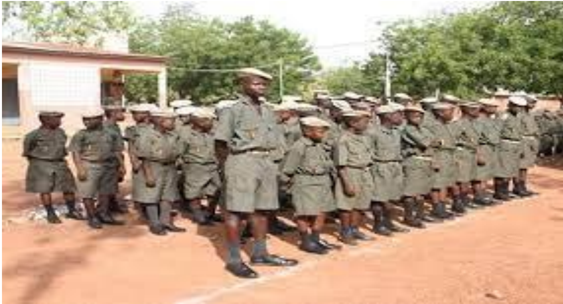
Prytanée militaire de Kati.