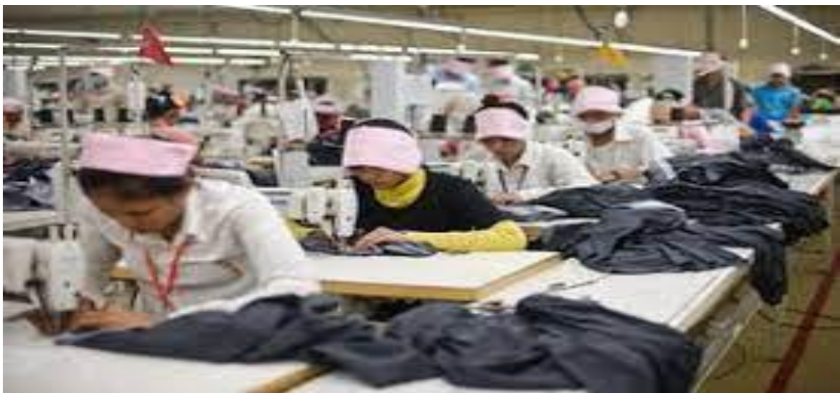
Travail à l'usine.