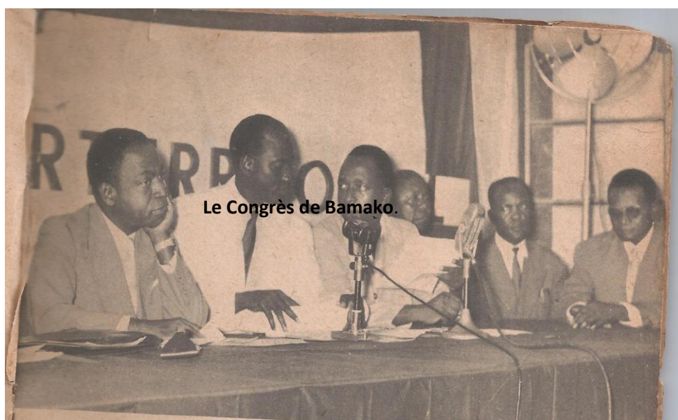
Congrès de Bamako.

Le Congrès de Bamako du R. D. A, en Octobre 1957 avait été préparé et présidé par Fily Dabo Sissoko. La conférence parvint à un accord d'autonomie interne des territoires africains et la transformation de l'A. O. F. et de l'A. E. F. en « Fédérations démocratiques constituées par ces territoires sur la base de la solidarité, de l'égalité et d'abandons volontaires de souveraineté territoriale ».